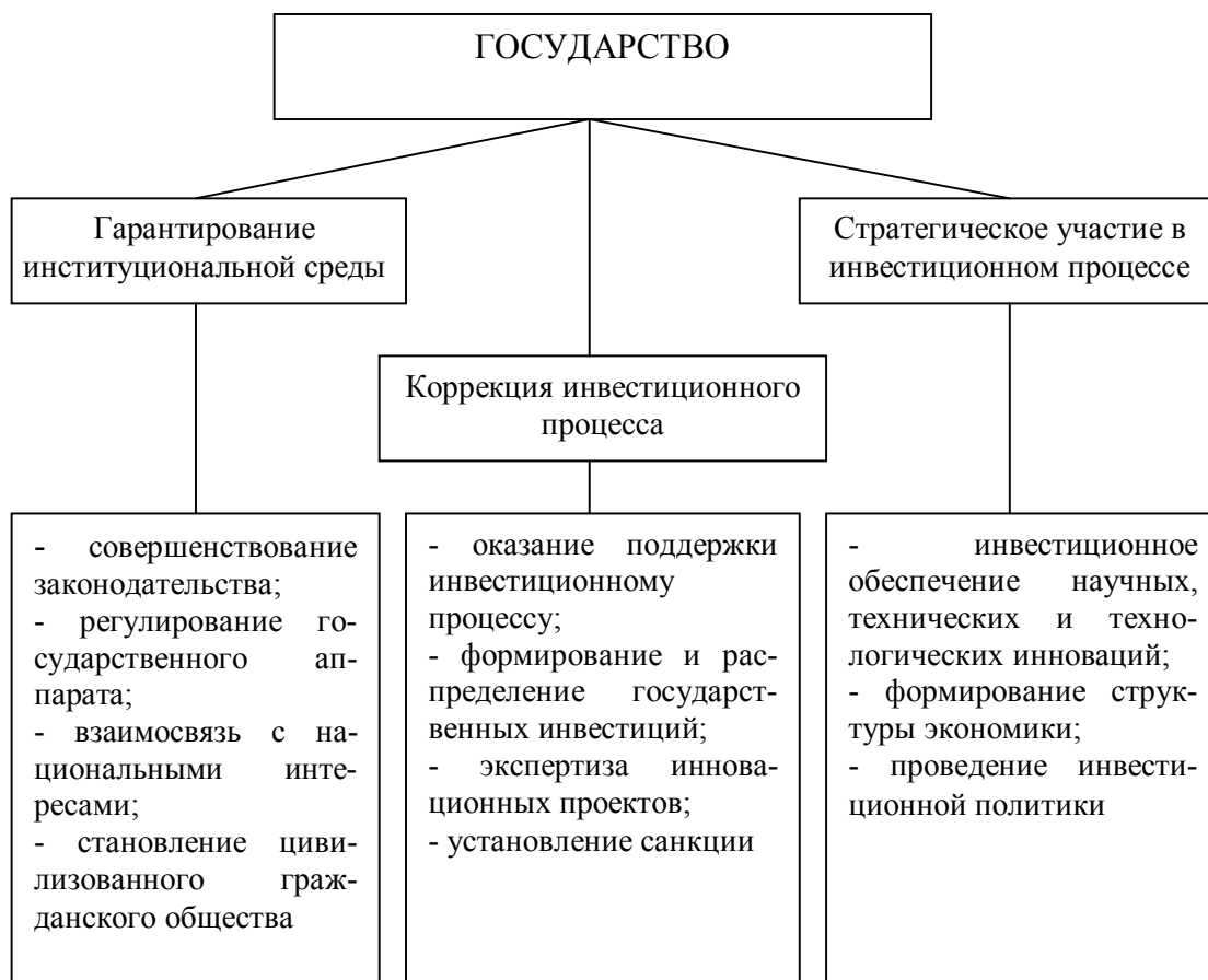
Рисунок 2 – Функции государства по обеспечению институциональной среды инвестиционного процесса

Экономика Казахстана и его отдельных регионов нуждается в разработке концепции и основных направлений эффективного государственного регулирования развития институциональной среды инвестиционного процесса.